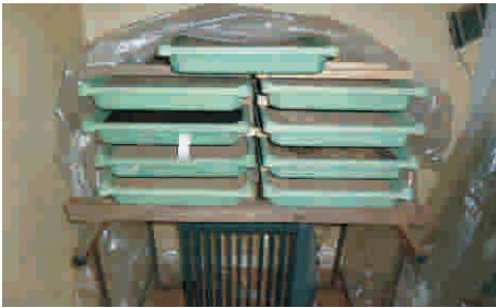
4. Die Aussaat an einen warmen Ort stellen. Nachtabenkung der Heizung beachten!