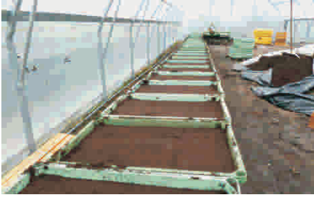
1. Aussaaterde andrücken