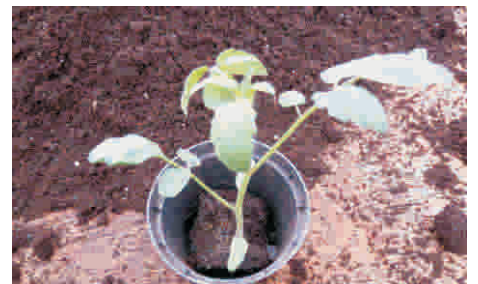
15. und mit Pflanzerde befüllen.