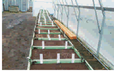
2. Saatgut gleichmäßig verteilen und beschriften