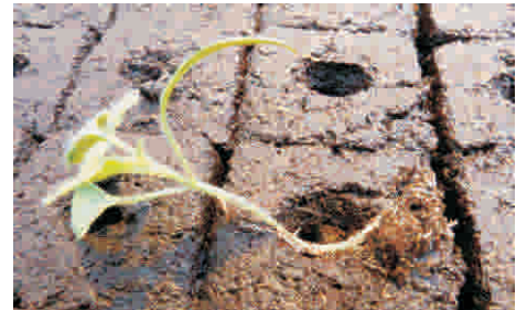
9. Pflanzen tiefer wegpflanzen... STABILITÄT