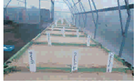
3. Mit feinem Sand bedecken +andrücken + wässern