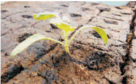
10. Pflanze pikiert