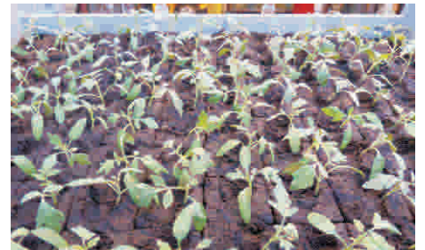
12. Pflanzen warm und hell platzieren