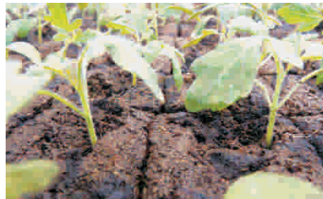
11. Nur gleichmäßige Pflanzengrößen zusammen pikieren.