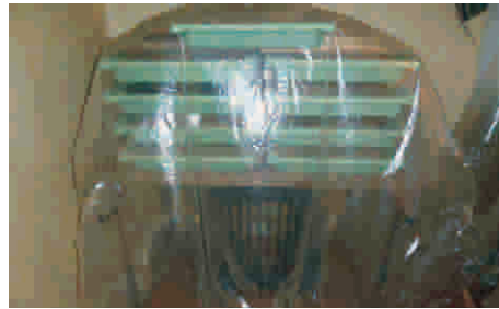
5. Mit einer Folie abdecken, um ein Austrocknen zu vermeiden.