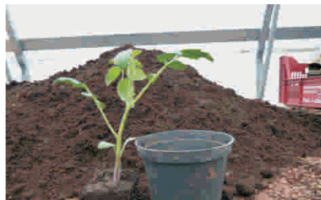
14. Pflanze in einem geeigneten Topf wieder tiefer wegpflanzen ...Stabilität.