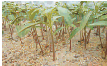
8. Pikierfähige Pflanzen