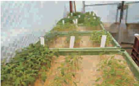
7. Keimlinge warm und hell platzieren