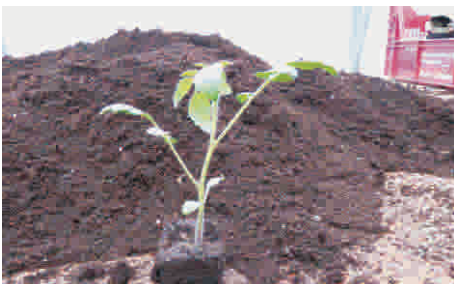
13. Pflanze zum Topfen